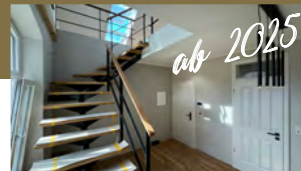
Klara Maisonette Nr. 02 Alles, nur nicht gewöhnlich!

Klara Maisonette-Apartment ist Ihr stilvolles Upgrade fürs Wohnen auf Zeit auf 2 Etagen Luxus pur!