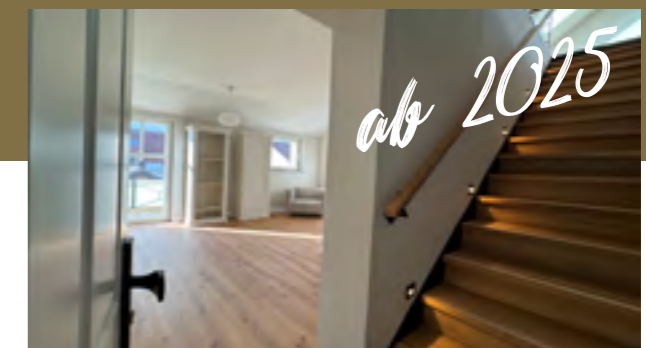
Emilia Maisonette Nr. 04 Modern, extravagant

Hier wird Wohnen zur großen Auszeit vom Alltag – und das mit jeder Menge Charme + sonnigem Balkon!