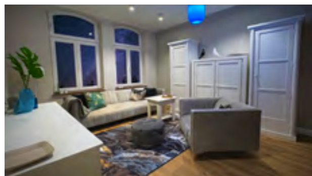
Vios Appartement Nr. 01 Panoramablick zum Park

> Vios Apartment I Klothilde I Klara I Emilia Maisonette