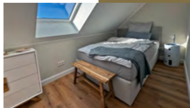
Klothilde Apartment Nr. 03 Feines Ambiente

Hochwertig eingerichtet, mit clever genutztem Raum und liebevollen Details, ist es der ideale Rückzugsort